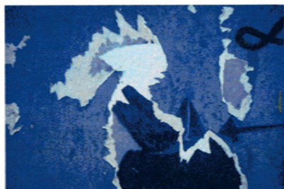
Jean Mohr, Affiche déchirée , Paris, 1965.

Zeitgleich zur Ausstellung werden in einem Saal des Kunstmuseums «abstrakte» Fotografien von Jean Mohr gezeigt.